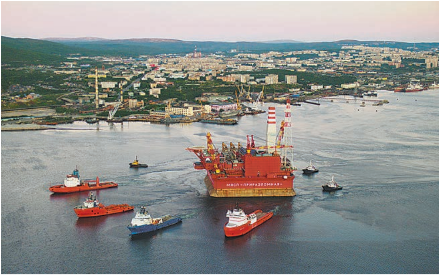
Морская ледостойкая нефтяная платформа «Приразломная» покидает причал завода «Севмаш» и отправляется к шельфовому месторождению в Печорском море.

Противники этой линии уже выступили с программными возражениями: в газете «Ведомости» накануне появилась статья бывшего замминистра энергетики Владимира Милова «Новая волна национализации», где говорится, что правительственный кабинет Дмитрия Медведева находится на распутье. С одной стороны, «пытается позиционировать себя как более современный и либеральный по сравнению с предшественниками» (нарек более чем прозрачен). С другой – кабинет потеряет этот имидж при согласовании сделки, «резко усиливающей роль государства в экономике и способствующей дальнейшей монополизации одной из ключевых ее сфер».