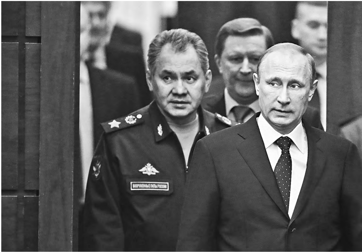
Военная доктрина России, подписанная президентом Владимиром Путиным, носит исключительно оборонительный характер.

В доктрине сказано: вероятность развязывания против нас широкомасштабной войны снизилась. Но в числе угроз названы наращивание и приближение к на-