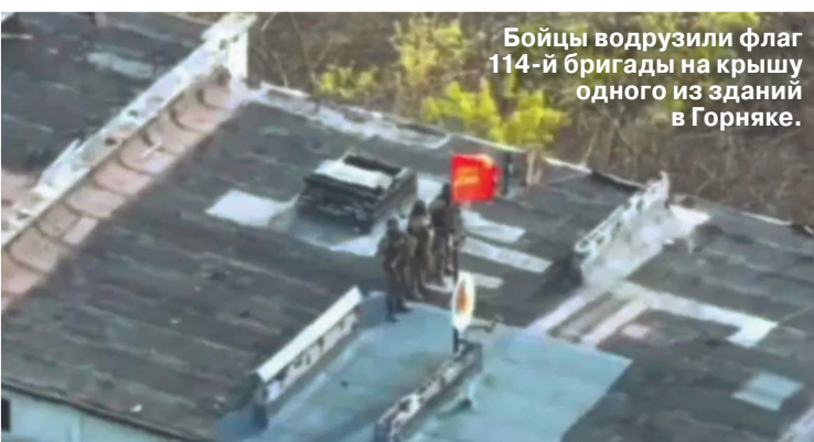
Бойцы водрузили флаг 114-й бригады на крышу одного из зданий в Горняке.