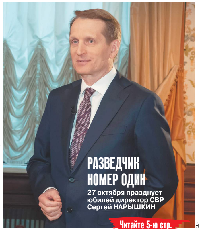
РАЗВЕДЧИН НОМЕР ОДИН

27 октября празднует юбилей директор СВР Сергей НАРЫШКИН