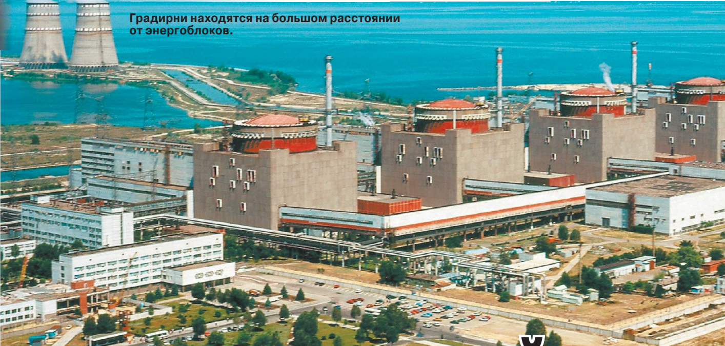
Градирни находятся на большом расстоянии от энергоблоков.