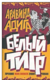
Адига А. Белый тигр / Пер. с англ. С.Соколова. М.: Фантом-пресс, 2010. — 352 с.

4 Балрам по прозвищу Белый тигр — простой парень из типичной индийской деревни. Среди своих братьев и сестер — самый смекалистый. Он всегда был «белым тигром», редчайшим зверем, которого можно встретить лишь раз в жизни. Он вырывается в город, где его ждут невиданные и страшные приключения, где он круто изменит свою судьбу, опустится на самое дно, а потом взлетит на самый верх.