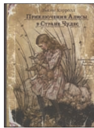
Кэрролл Л. Приключения Алисы в Стране Чудес / Пер. с англ. Н.Демуровой; Ил. А.Рэкхема. М.: Издательский Дом Мещерякова, 2010. — 160 с. — (Книга с историей).

6 Очередной выпуск прекрасной серии, имитирующей книги, «бывшие в употреблении». Снова якобы потерятая обложка, желтоватые страницы в пятнах, старые штампы букинистических магазинов... И, конечно, ставший уже классическим перевод Нины Демуровой со старинными английскими иллюстрациями.