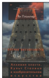
Плампер Я. Алхимия власти. Культ Сталина в изобразительном искусстве / Авторизованный пер. с англ. Н.Здельмана. М.: Новое литературное обозрение, 2010. — 496 с. — (Очерки визуальности).

5 Эта книга не потеряется в потоке «сталинианы», потому что Ян Плампер заглянул на «кухню» советской пропаганды, где готовился ее главный продукт — миф о «любимом вожде». Миллионы советских людей никогда не видели Сталина вживую, но были уверены, что «видели» его. О том, как и кем создавалась эта великая иллюзия, и пишет автор.