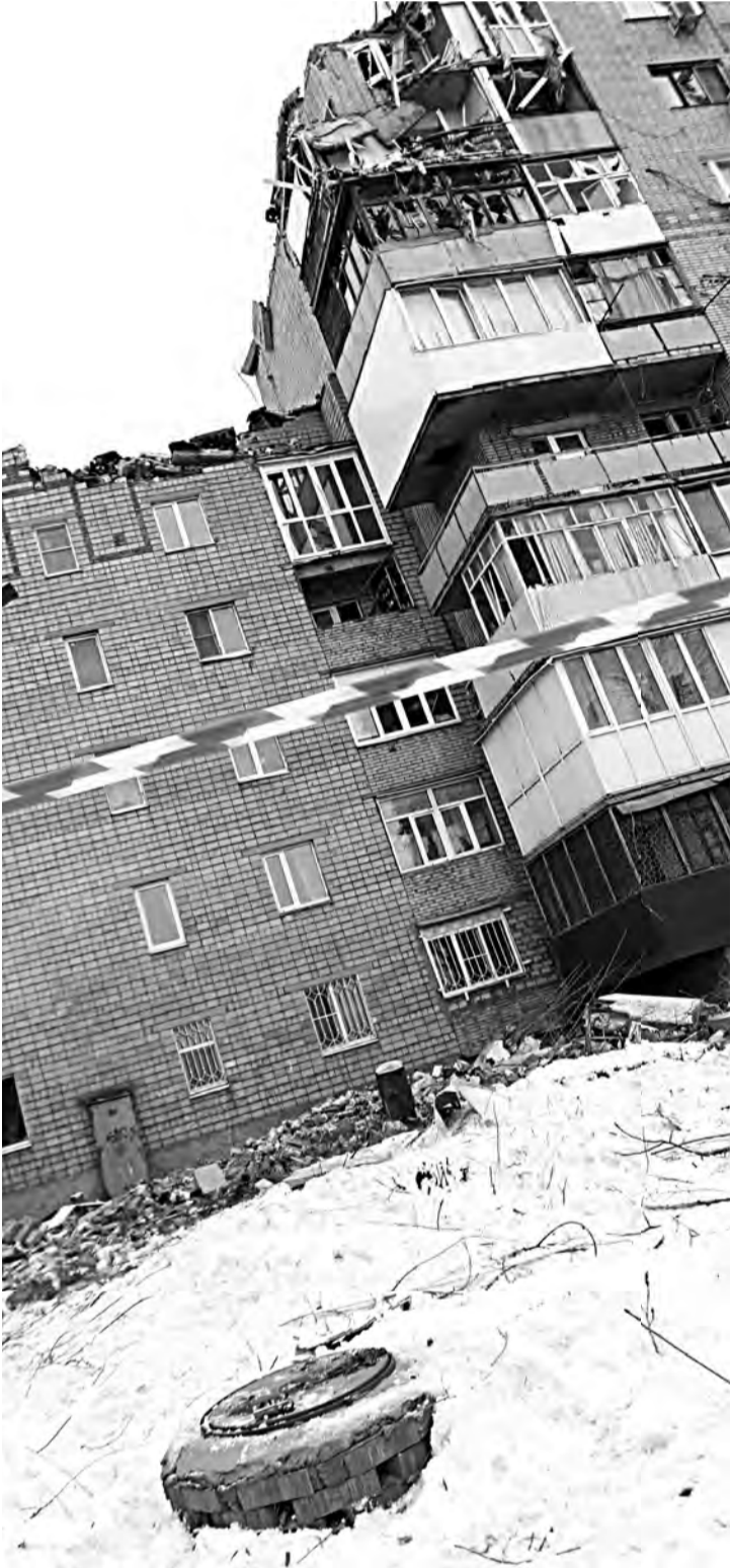
Взрывом снесло верхнюю часть здания.

Как рассказала хозяйка квартиры, ее разбудил пронзительный звук сработавшего на задымление пожарного датчика. Автономный пожарный извещатель сотрудники МЧС установили в этом доме накануне Нового года в рамках социальной акции. МАРИНА ЧЕРНЯВСКАЯ