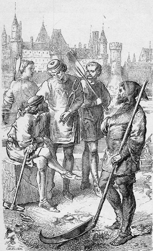
LES GENS DE MÉTIERS, d'après Herbé (Bibl. nationale) et P. Lacroix. — Le Louvre sous Charles V (dans le fond).