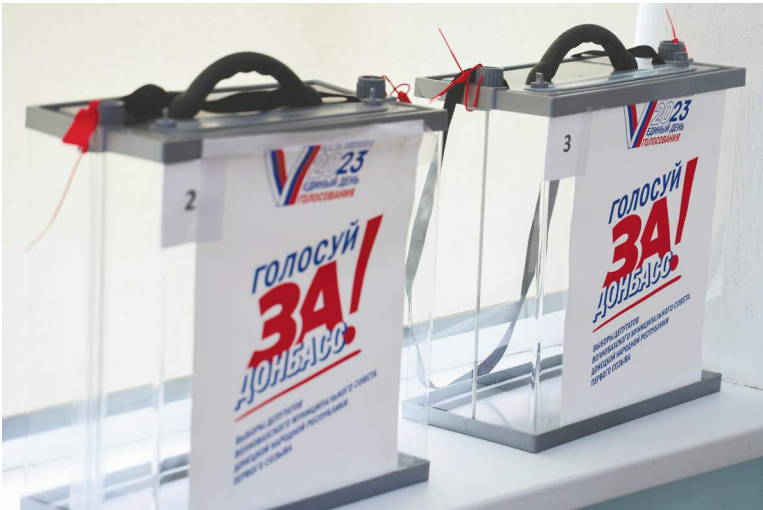
На выборном участке в Донецке.