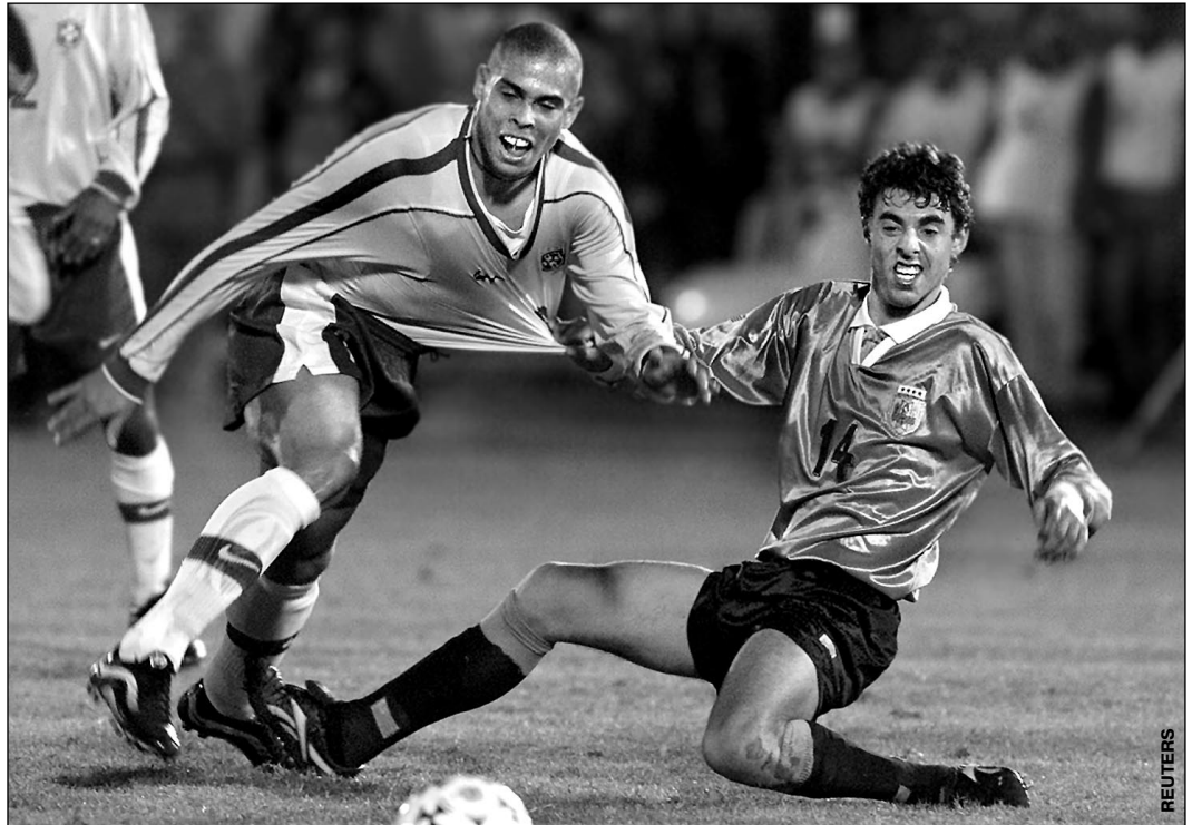
Воскресенье. Асунсьон. Бразилия - Уругвай - 3:0. Одно из лучших бомбардиров Copa America-99 РОНАЛДО атакует уругваец ДАНИЭЛЬ ЛЕМБО (№ 14).

Завершившийся в Парагвае розыгрыш Кубка Америки стал одним из главных футбольных событий 1999 года. Безоговорочным победителем вновь стала Бразилия. Четырехкратные чемпионы мира в финале разгромили двукратных чемпионов мира уругвайцев - 3:0.