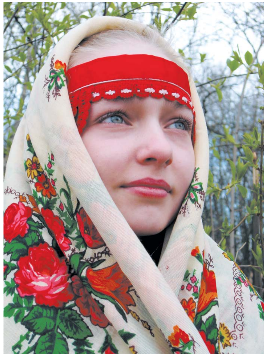
Фотоконкурс «Выбираю «Детскую школьную академию». Фото Ярослава Лобова, 10 лет, Московская обл.