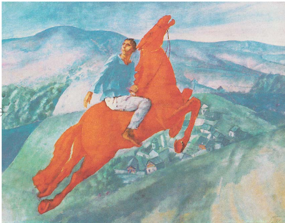
К.С. ПЕТРОВ-ВОДКИН. Фантазия . 1925. (См. с. 23–25)