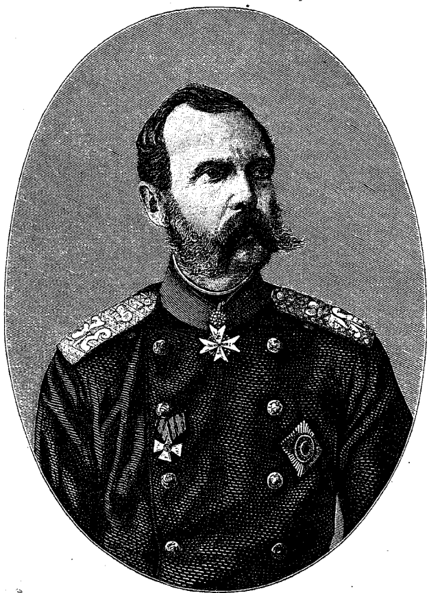
ЕГО ИМПЕРАТОРСКОЕ ВЕЛИЧЕСТВО ГОСУДАРЬ ИМПЕРАТОРЪ АЛЕКСАНДРЪ II-й, НИКОЛАЕВИЧЪ. (1855 — 1881).