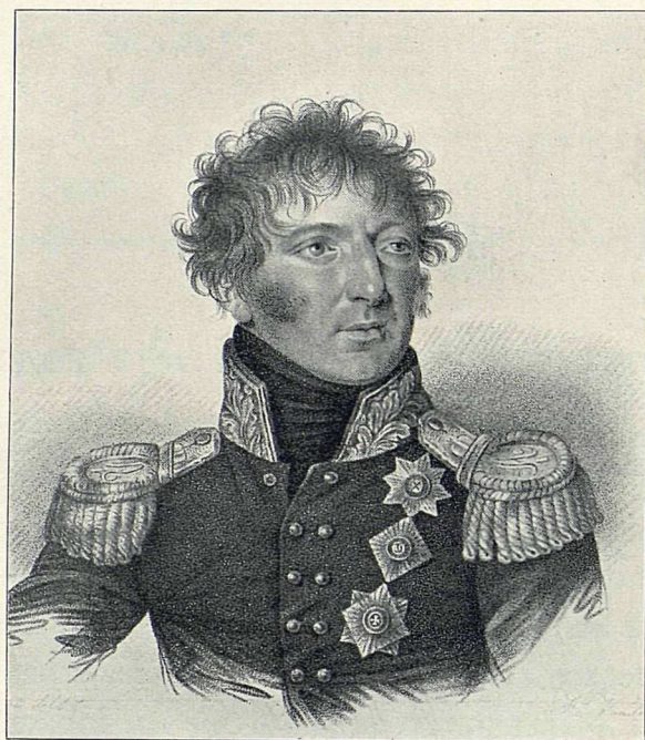
М. А. Милорадовичъ, съ прав. Вендрамини, по рис. Сентъ-Обэнъ.

обладалъ всѣми качествами отличнаго воина. «Прекрасный собою, одѣтый въ бояхъ и на бивакахъ, какъ на парадѣ, щеголемъ, во всѣхъ орденахъ, съ высокимъ перомъ на шляпѣ, иногда обвязанный богатою шалью, онъ, подобно Мюрату, являлся на борзомъ конѣ вездѣ, гдѣ могъ встрѣтить лицомъ къ лицу опасность». Въ дѣлахъ онъ былъ неутомимъ, первый въ огнѣ, послѣдній на отдыхѣ. Своей неизмѣнной отвагою, бодростью духа, онъ внушалъ командуемымъ войскамъ отвагу и способность къ перенесенію тягостей, сопряженныхъ съ войною. Не могло быть лучшаго начальника для арьергарда, точно также какъ и для авангарда. Арьергардъ, неотступно тѣснимый неутомимымъ Мюратомъ, отступалъ спокойно шагъ за шагомъ, не оставляя за собою въ добычу непріятелю ни обозовъ, ни отсталыхъ. Главныя силы, охраняемыя войсками арьергарда, подъ предводительствомъ Милорадовича, увѣрены были въ спокойствіи на отдыхахъ, стольнеобходимомъ послѣ Бородинскаго сраженія. По всему пути до Москвы и за Москвою къ другимъ полкахъ 1-го резервнаго кавалерійскаго корпуса, почти всѣ лошади были набиты 1) ).