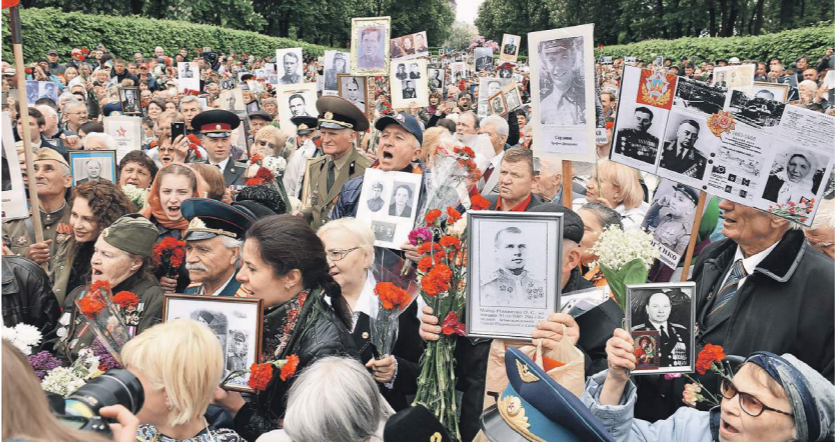
В прошлом году «Бессмертный полк» собрал на Украине 600 тысяч человек

В этом году на Украине акция «Бессмертный полк» 9 Мая должна собрать не менее миллиона человек. Об этом «Известиям» рассказали организаторы памятного шествия. Несмотря на угрозы радикалов сорвать мероприятие, марш состоится в Киеве, Харькове, Одессе, Днепрпетровске, Николаеве, Запорожье и даже во Львове. Акция пройдет при участии украинских политиков. Это «Известиям» подтвердили депутаты Верховной рады. Уже пятый год организаторы «Бессмертного полка» на Украине сталкиваются с большими проблемами из-за попыток властей и националистов помешать проведению памятной акции. Несмотря на это, марш пройдет в большинстве крупных городов страны. В едином координационном центре «Бессмертный полк Украины» «Известиям» пояснили, что «во избежание провокаций организаторы в каждом го-