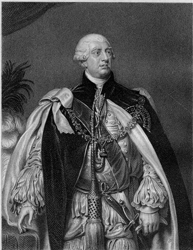
Painted by Sir Tho s Lawrence. P.R.A.