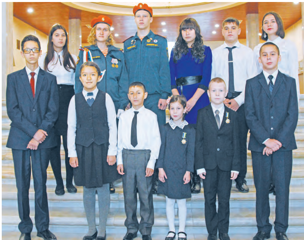
ПРЕСС-СЛУЖБА ГОССОБРАНИЯ РБ