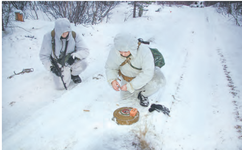
Работа с минами - основа подготовки сапёров.