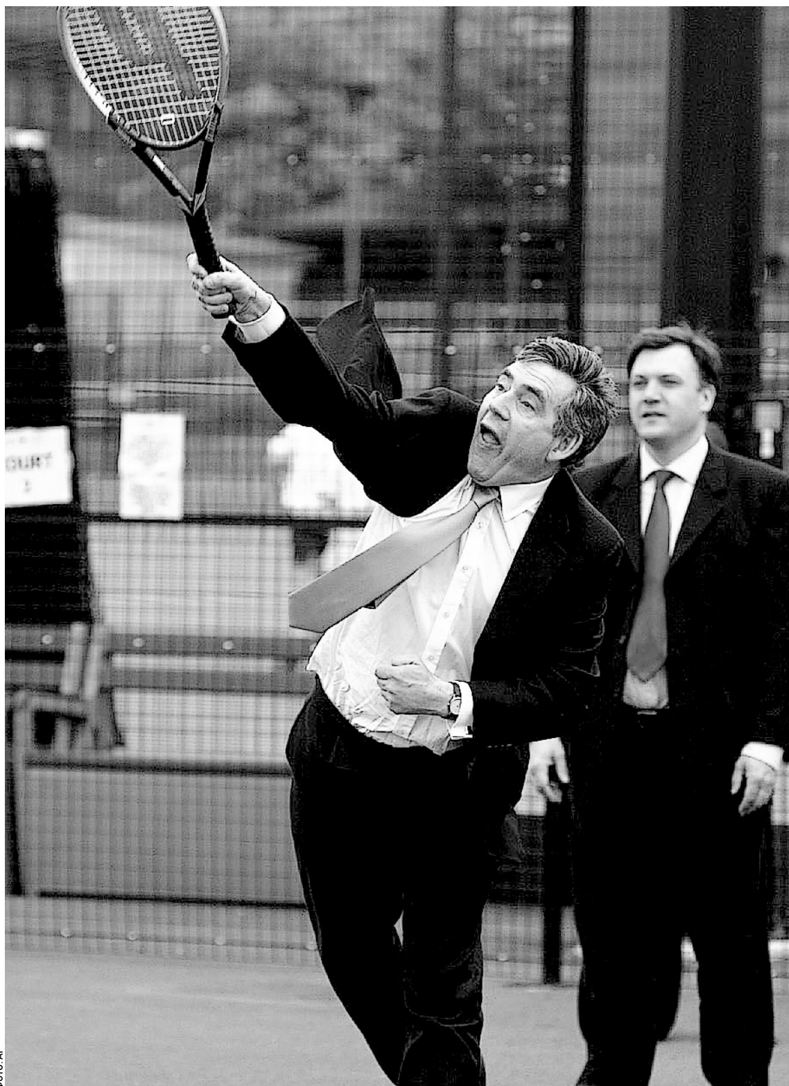
БРИТАНСКИЙ ПРЕМЬЕР-МИНИСТР готов нанести удар

Когда этот номер подписывался в печать, глава британского «Форин офис» (как традиционно называют МИД в Британии) еще не выступал, его спич ожидался в 18.30 мск. Однако «осведомленный источник», на которого ссылается в номере за понедельник лондонская «Файнэншл таймс», уверяет: ответ Лондона будет жестким. «Ответ» — это очень важное слово. → стр. 2