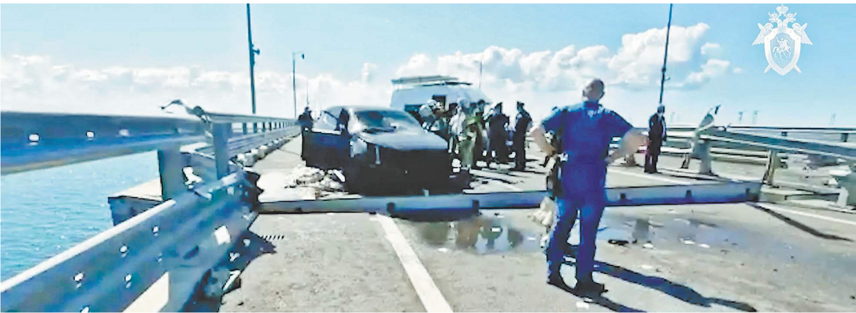
Российские следователи однозначно квалифицировали произошедшее на Крымском мосту как теракт.

ранее комиссии по ликвидации последствий повреждения Крымского моста вылетели на место происшествия. Напомним, это уже второй теракт, совершенный украинскими спецслужбами в отношении Крымского моста. Рано утром 8 октября 2022 года на мосту был подрыван грузовик, начиненный взрывчаткой. Погибли четыре ни в чем не повинных человека.