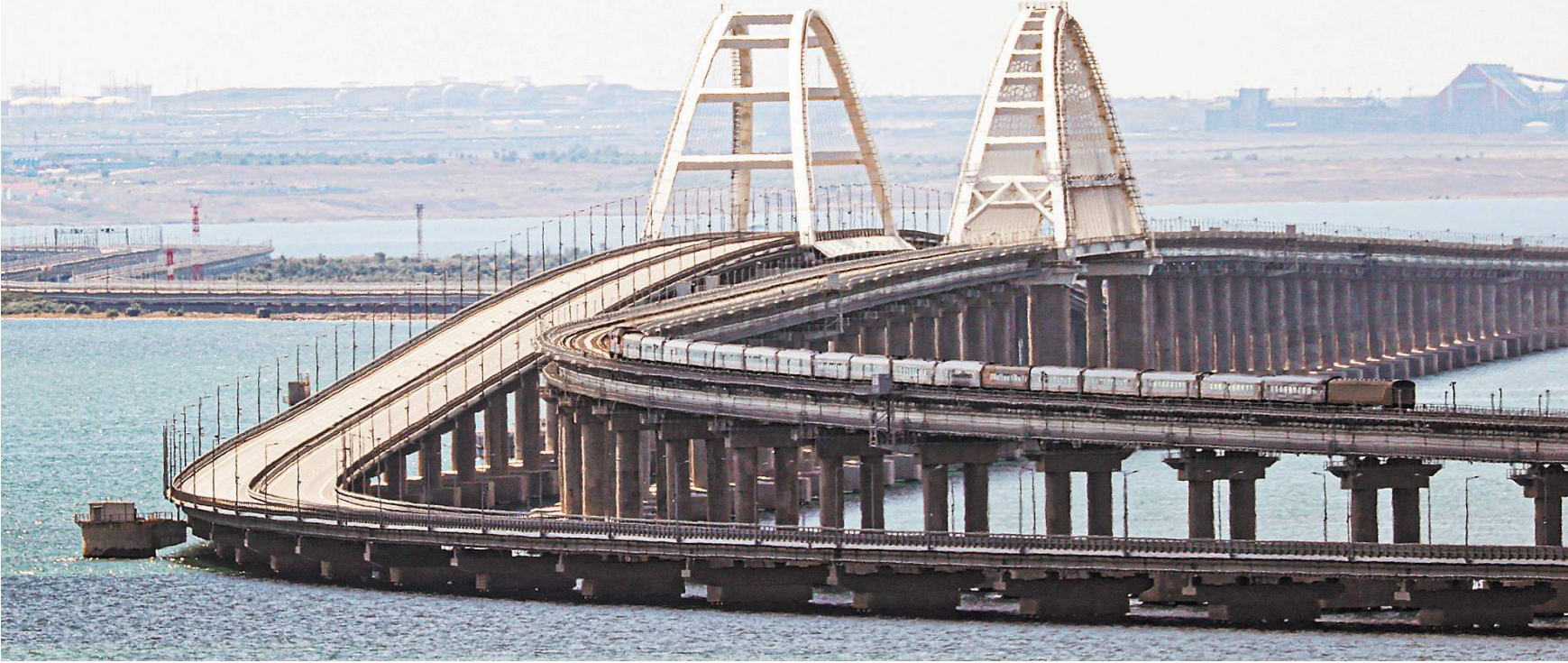
Крымский мост вновь был атакован киевским режимом. Если ранее они использовали грузовик со взрывчаткой, то в этот раз применили боевые надводные беспилотники.

«Строители уже занимаются обследованием моста, к вечеру будет понята ситуация по срокам и возможности его восстановления», — сообщил в видеообращении вице-премьер РФ Марат Хуснуллин. Он добавил, что представители созданной