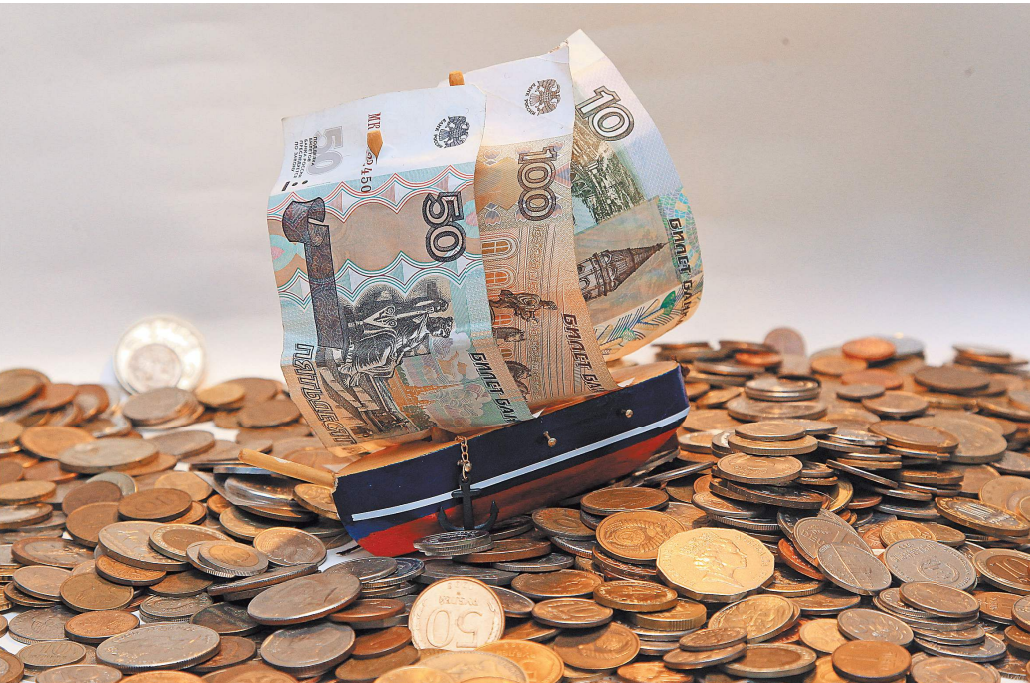
Россияне смогут обеспечить себе более высокий уровень жизни при выходе на пенсию.

Суть программы состоит в том, что российским гражданам, желающим вложить свои деньги выгодно, просто нужно будет выбрать оператора (негосударственный пенсионный фонд, НПФ), который будет инвестировать деньги и управлять ими. Затем нужно будет заключить договор и уплатить добровольные взносы. Определить размер первого взноса, периодичность и сумму регулярного пополнения счета, а также сро-