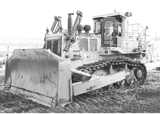
Новый бульдозер весом более 70 тонн и мощностью почти в 600 лошадиных сил поступил на Михайловский горно-обогатительный комбинат в Курской области. В парке МГОКа он стал наиболее сильной машиной на гусеничном ходу.