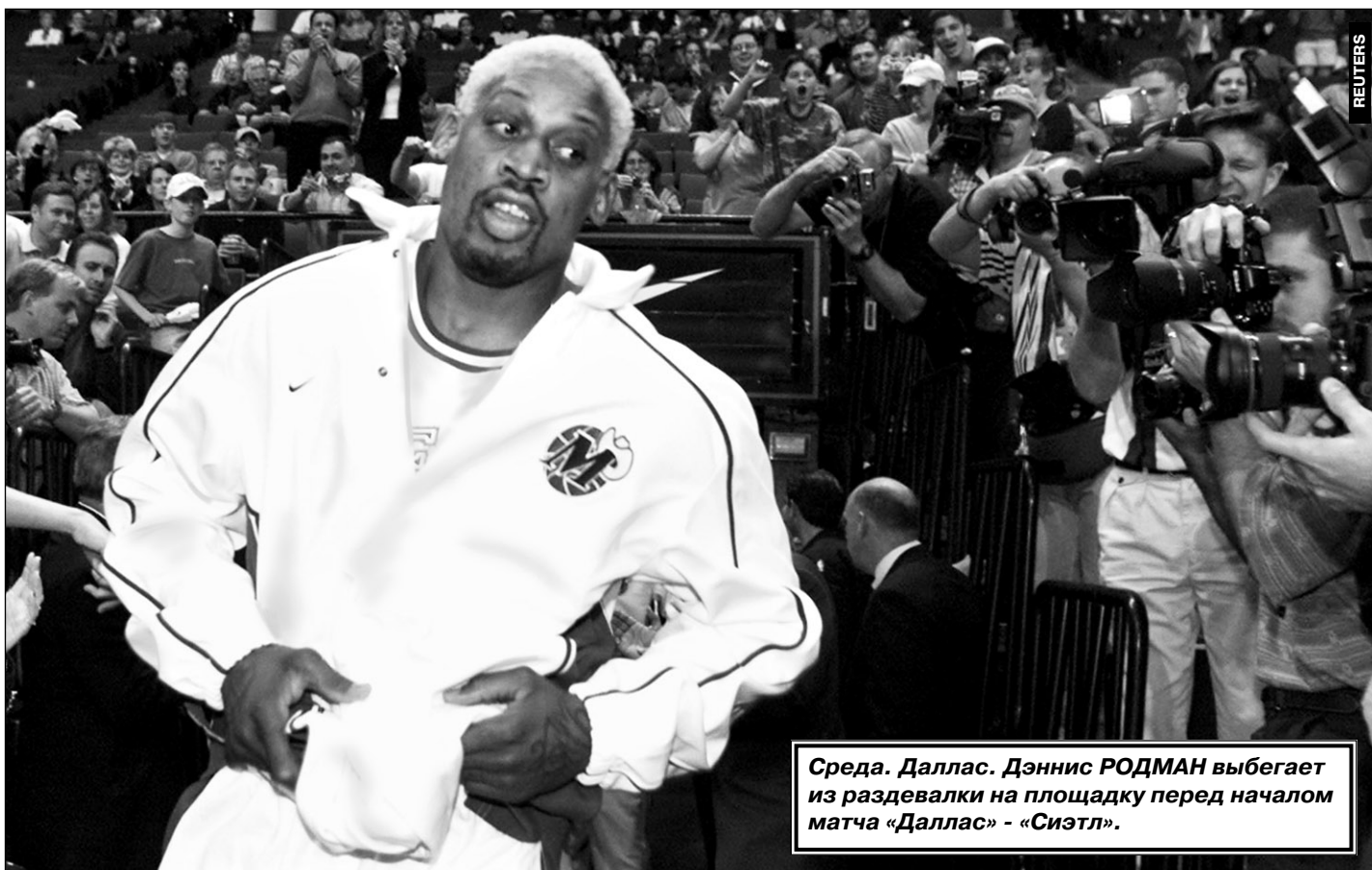
Среда. Даллас. Дэннис РОДМАН выбегает из раздевалки на площадку перед началом матча «Даллас» - «Сиэтл».

В среду Дэннис Родман, самый скандальный баскетболист мира, вернулся в НБА после 10-месячного перерыва и сыграл первый матч в составе своей новой команды - «Даллас Маверикс». 38-летний форвард начал домашнюю встречу против «Сиэтл Суперсоникс» в стартовой пятёрке. За 32 минуты, проведенные на площадке, Родман не набрал ни одного очка, но зато сделал 13 подборов. Правда, результат матча оказался не в пользу «Далласа» - 106:117.