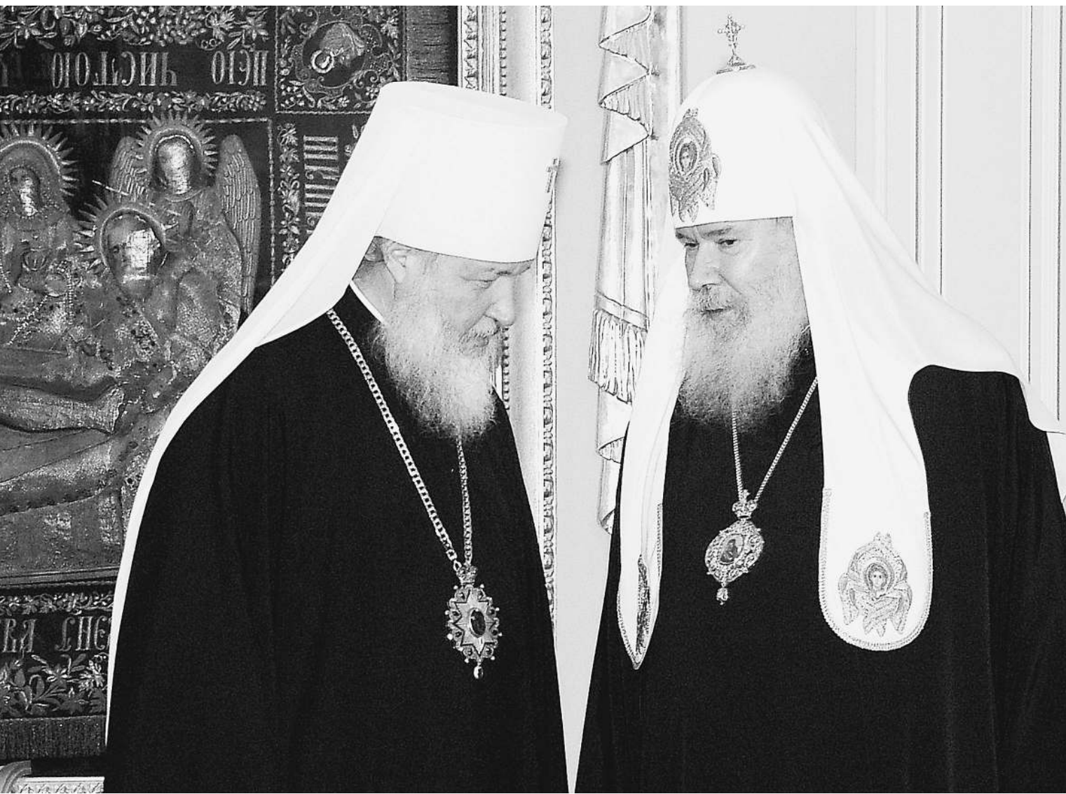
Митрополит Кирилл (слева) и Святейший патриарх Алексий II остро чувствуют боль бедных

Вчера в Москве открылся XI Всемирный русский народный собор. Это крупнейший общественный форум, главой которого является Святейший патриарх Московский и всея Руси Алексий II. На этот раз повестка дня собора была сформулирована так: «Богатство и бедность: исторические вызовы России». И уже на первом пленарном заседании было заявлено — православие вопреки мифам вовсе не отрицает богатства, но требует ответственного к нему отношения. Богатым нужны новые стандарты поведения.