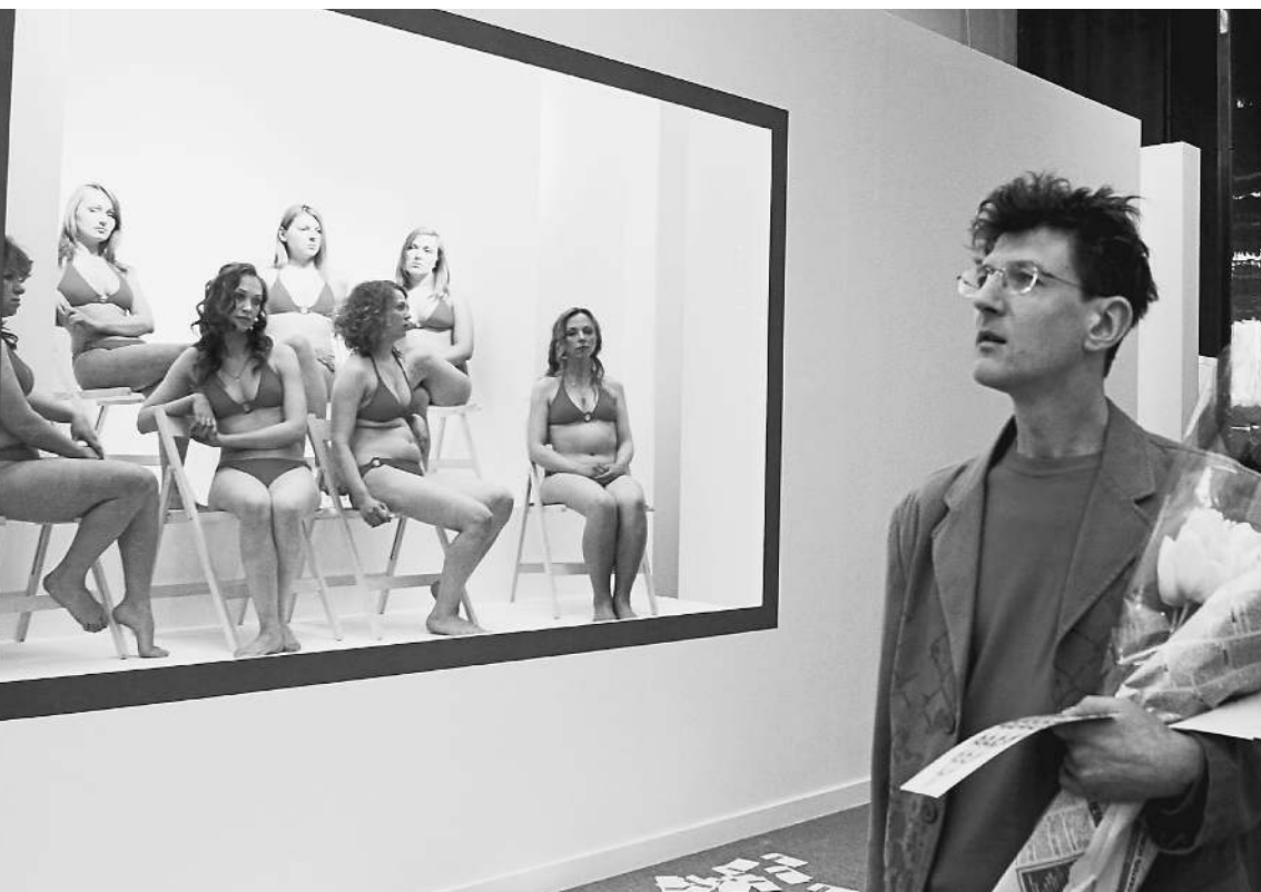
Большинство мужчин в России считают Женский день «своим личным праздником»

В день праздника многие женщины будут приятно удивлены. Как сообщил вчера Всероссийский центр изучения общественного мнения (ВЦИОМ), в этом году их ждет существенный (по некоторым позициям — свыше 10%) рост числа подарков. Однако доля мужчин, готовых эти подарки дарить, год от года снижается. Правда, всего на 1—2%, но социологи уже ищут объяснение причин этого явления. → стр. 4