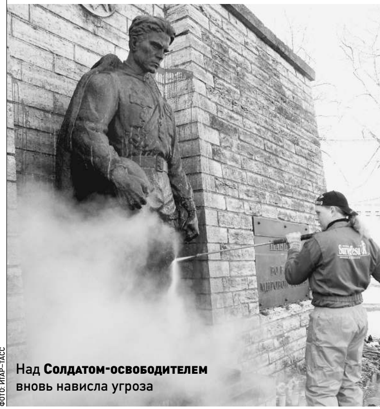
Над Солдатом-освободителем вновь нависла угроза

Ансипу гораздо выгоднее заключать союз с радикальными «Союзом отечества» и «Республикой», а для «полноты картины» привлечь левые силы — то есть социал-демократов. Именно такой вариант выглядит сегодня наиболее вероятным. Сам премьер признал: у его партии больше точек соприкосновения с национал-радикалами. Впрочем, переговоры о создании коалиции только начались. И полностью сбрасывать со счетов вариант «реформистско-центристского» объединения нельзя. → стр. 4