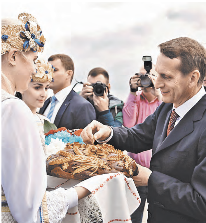
Председателя союзного парламента Сергея Нарышкина в Гродно встречали как самого дорогого гостя — хлебом-солью.

В работе сессии приняли участие депутаты Парламентского собрания, представители Постоянного Комитета Союзного государства, министерств и ведомств Беларуси и Российской Федерации, а также руководство Гродненского областного исполнительного комитета.