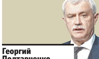
Георгий Полтавченко, губернатор Санкт-Петербурга:

— Сотрудничество с Беларусью приоритетно для Санкт-Петербурга. В 2014 году наш общий товарооборот увеличился на три процента и составил почти два миллиарда долларов. Мы предлагаем белорусским предприятиям стать постоянными участниками выставки на базе Центра импортозамещения, который откроется осенью нынешнего года.