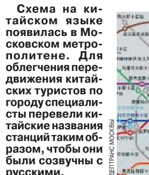
Схема на китайском языке появилась в Московском метрополитене. Для облегчения передвижения китайских туристов по городу специалисты перевели китайские названия станций тактиком образом, чтобы они были созвучны с русскими.

Как стало известно «МК», названия станций метро, МЦК, МЦД и других объектов, таких как вокзалы и аэропорты, перевели на китайский вместе с носителями языка согласно правилам китайской грамматики. Это поможет гостям из Поднебесной лучше