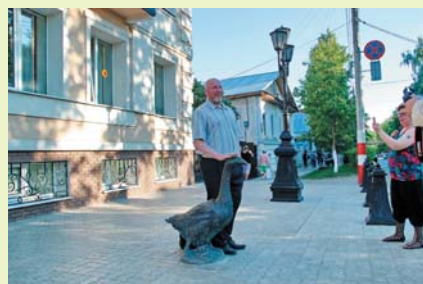
Гусь — символ Арзамаса