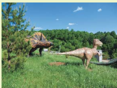
В парке и зоопарке Пешеланского гипсового завода