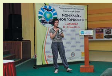
Пленарное заседание в конференц-зале «Морозовский»