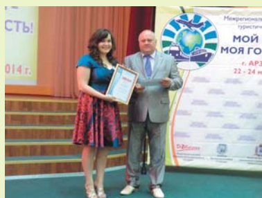
Награждение победителей конкурса