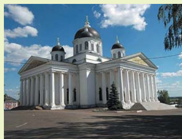
Воскресенский кафедральный собор