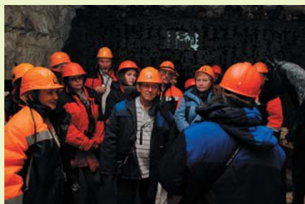
На экскурсии в шахте ПГЗ