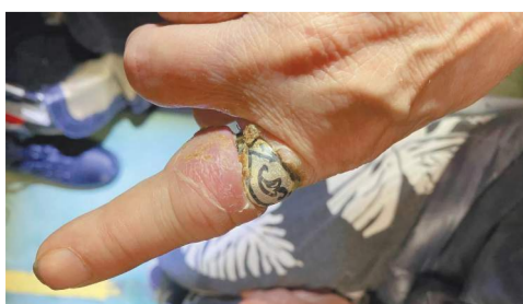
Часть организма едва не стал для 60-летней жительницы Богородского

пенсионерка поняла, что она не может снять кольцо даже при помощи мыла. Оно так глубоко вошло в мягкие ткани, что избавиться от аксессуара стало просто невозможным. При этом носить вещь становилось все больнее и больнее, палец сильно опух. Страдала женщина пришлось обратиться в больницу, а медики уже вызвали на помощь спасателей.