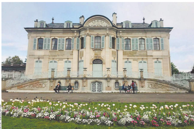
В усадьбе Ла-Гранж на окраине Женевы в июне 2021 года встречались президенты РФ и США. Теперь же встреча лидеров двух держав вряд ли состоится в Швейцарии.