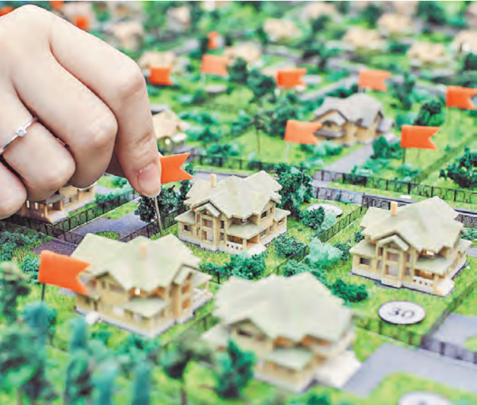
Чиновники не вправе устанавливать надуманные запреты гражданам на строительство домов.