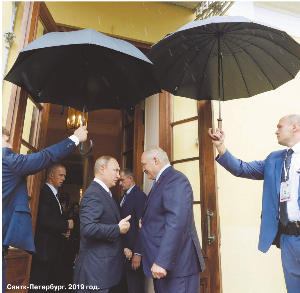
Санкт-Петербург. 2019 год.