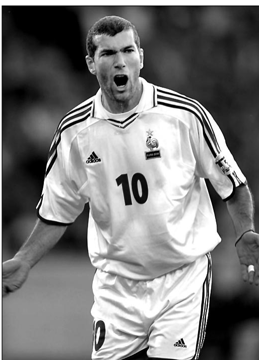
40 процентов читателей «СЭ», принявших участие в интернет-опросе, считают, что команда Луиша ФИГУ не пустит в финал сборную Зинедина ЗИДАНА.