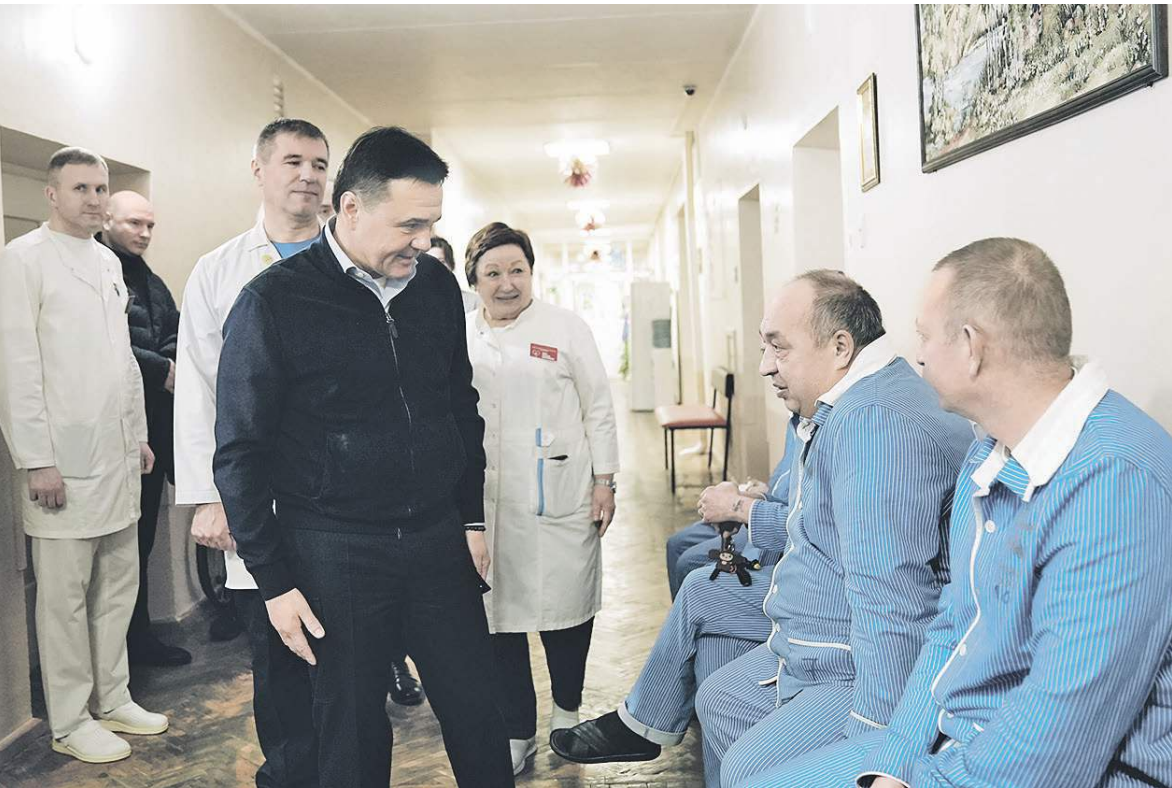
Губернатор Московской области Андрей Воробьёв с выздоравливающими бойцами.

Губернатор Московской области Андрей Воробьёв навестил раненых бойцов в военном госпитале под Солнечногорском