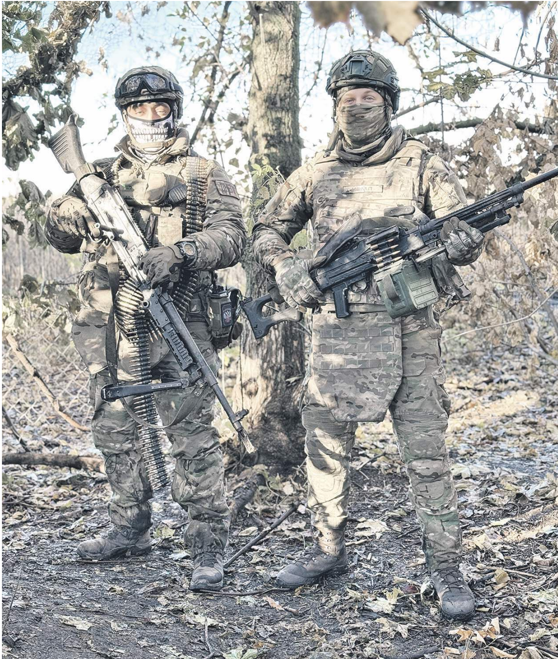
Здесь даже «птицам» летать запрещено!

Получив первый боевой опыт, молодой офицер быстро понял, что основная угроза сейчас не столько в армейской авиации противника, сколько в большом количестве дронов, применяемых нацистами не только по переднему краю, но и по тыловым коммуникациям.