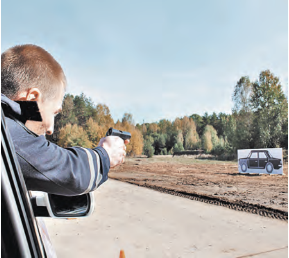
Самой зрелищной была стрельба по мишеням из движущегося автомобиля.