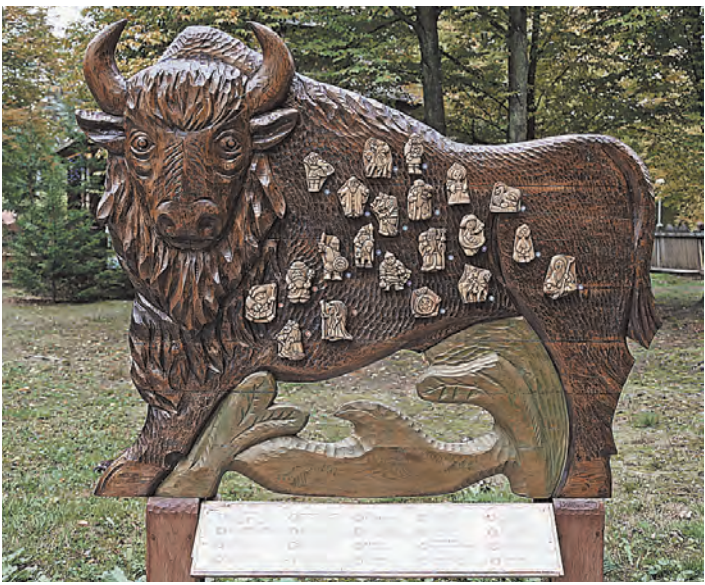
Беловежская Пуща стала последним пристанищем дикой популяции зубров.

ние зубра? Ведь немало представителей флоры и фауны в свое время исчезли с лица земли. Вот только и древний лес, и его обитателей на протяжении столетий усердно истреблял сам человек, так что он теперь и в ответе перед природой. Исследователи утверждают: к XVIII веку люди уничтожили древних быков почти во всех странах Европы. Леса Беловежской Пущи стали последним местом обитания дикой популяции зубров.