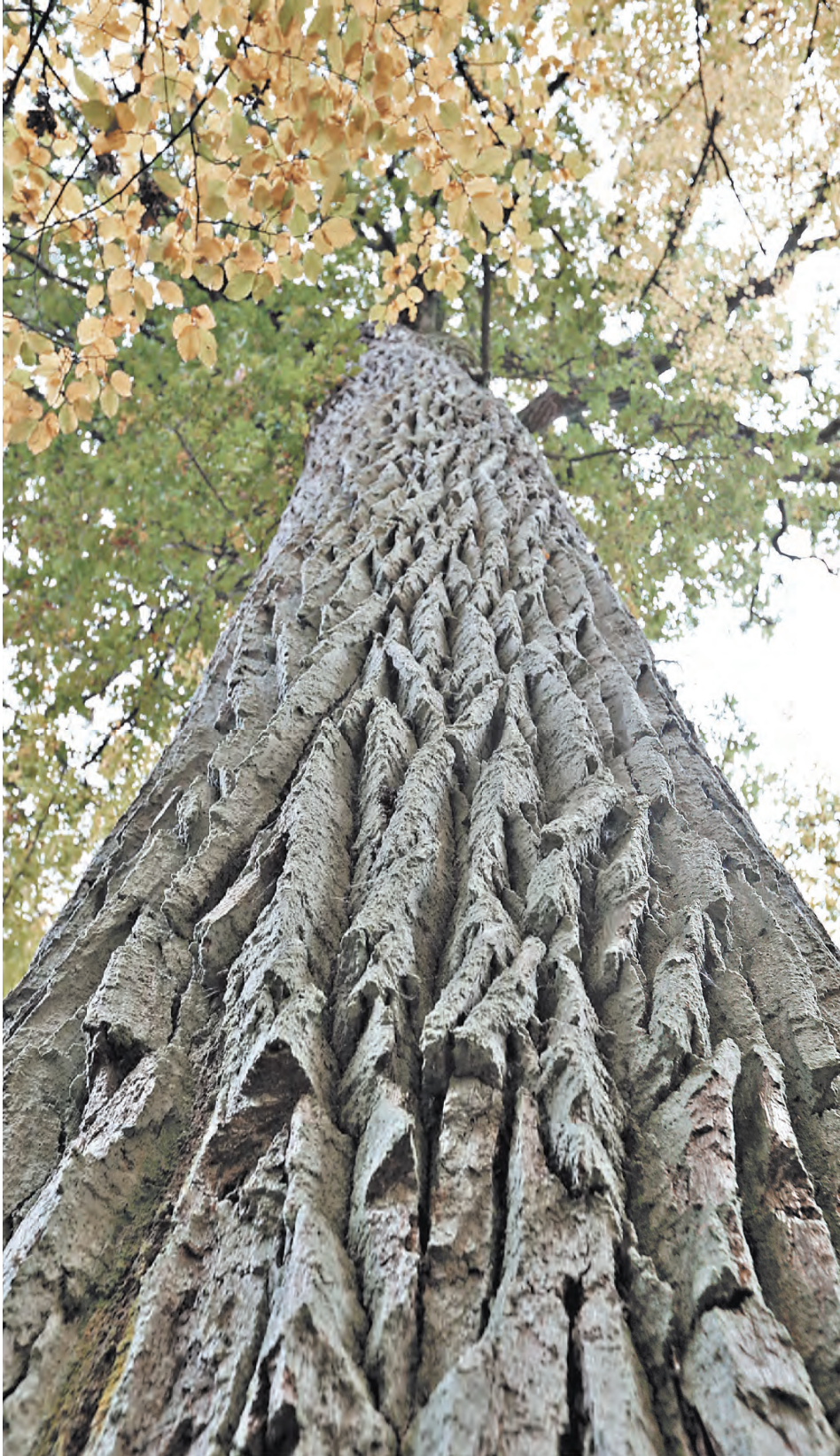
Этот дуб-патриарх наш фотокор встретил в минувшие выходные в Беловежской Пуще. Дереву более 600 лет! Новая союзная программа нацелена в том числе и на сохранение таких исполинов.

— Проект программы готов, объемы финансирования обозначены, наши специалисты подтвердили наличие необходимых средств в союзном бюджете.