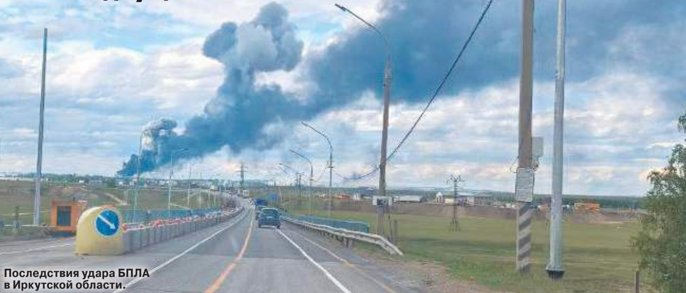
Последствия удара БПЛА в Иркутской области.

Если до кого-то все никак не доходило, почему Россия отказывается от безусловного перемирия, то в ночь на воскресенье и в воскресенье днем можно было увидеть, как такое перемирие будет выглядеть в реальности. Теракты против мирного