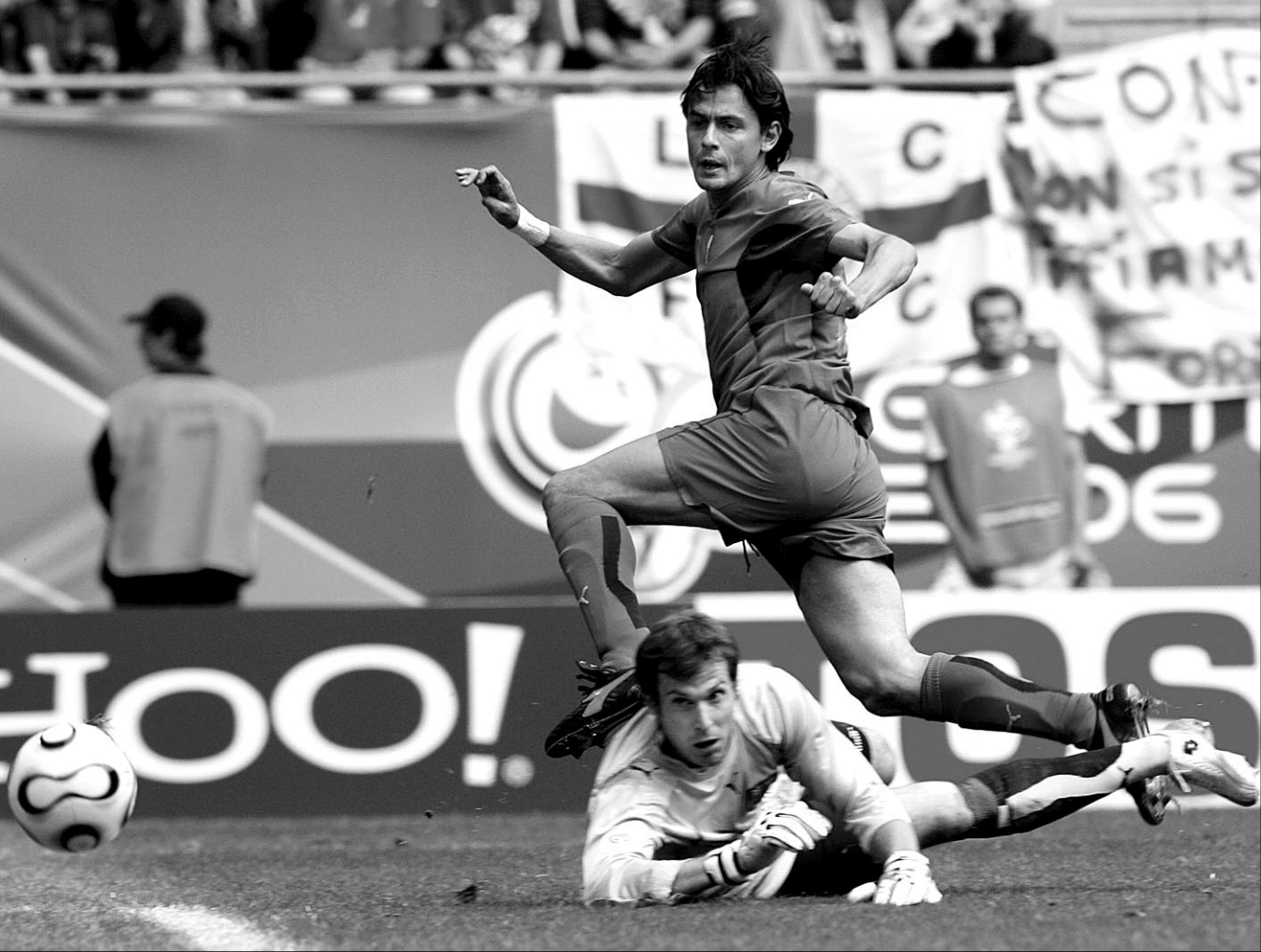
Вчера. Гамбург. Чехия - Италия - 0:2. 87-я минута. Филиппо ИНДЗАГИ открывает счет своим голам на чемпионатах мира.

- Скажем так: если можно обойтись на этом этапе без встречи с Бразилией, то никто возражать не будет. А предположений по 1/8 финала у меня нет. Кто бы нам ни достался, легкого матча не будет.