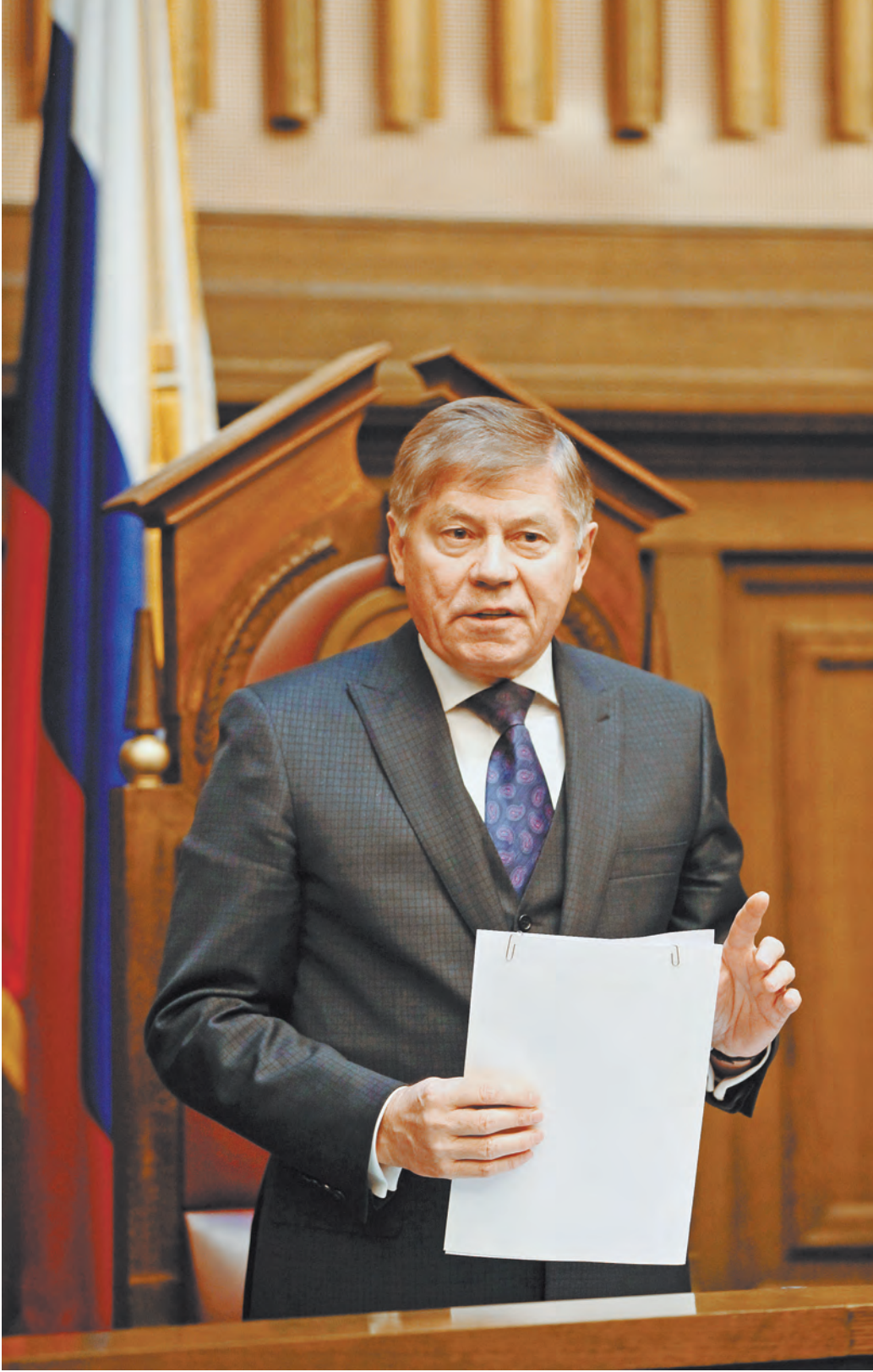
Председатель Верховного суда России Вячеслав Лебедев: за последние 10 лет количество осужденных к реальному лишению свободы сократилось на 40 процентов.

За последние 20 лет Пленум Верховного суда РФ 27 раз обращался к вопросам назначения наказаний и избрания мер пресечения несо-