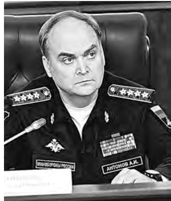
Замминистра обороны А. Антонов.

Вчера в Национальном центре управления обороной РФ прошел брифинг, где российским и иностранным журналистам, а также аккредитованным в Москве военным атташе зарубежных стран были представлены убедительные доказательства того, что Турция участвует в незаконной транспортировке нефти из Ирака и Сирии. А вырученные от ее продажи средства, в том числе, идут на вербовку новых боевиков и покупку оружия и боеприпасов