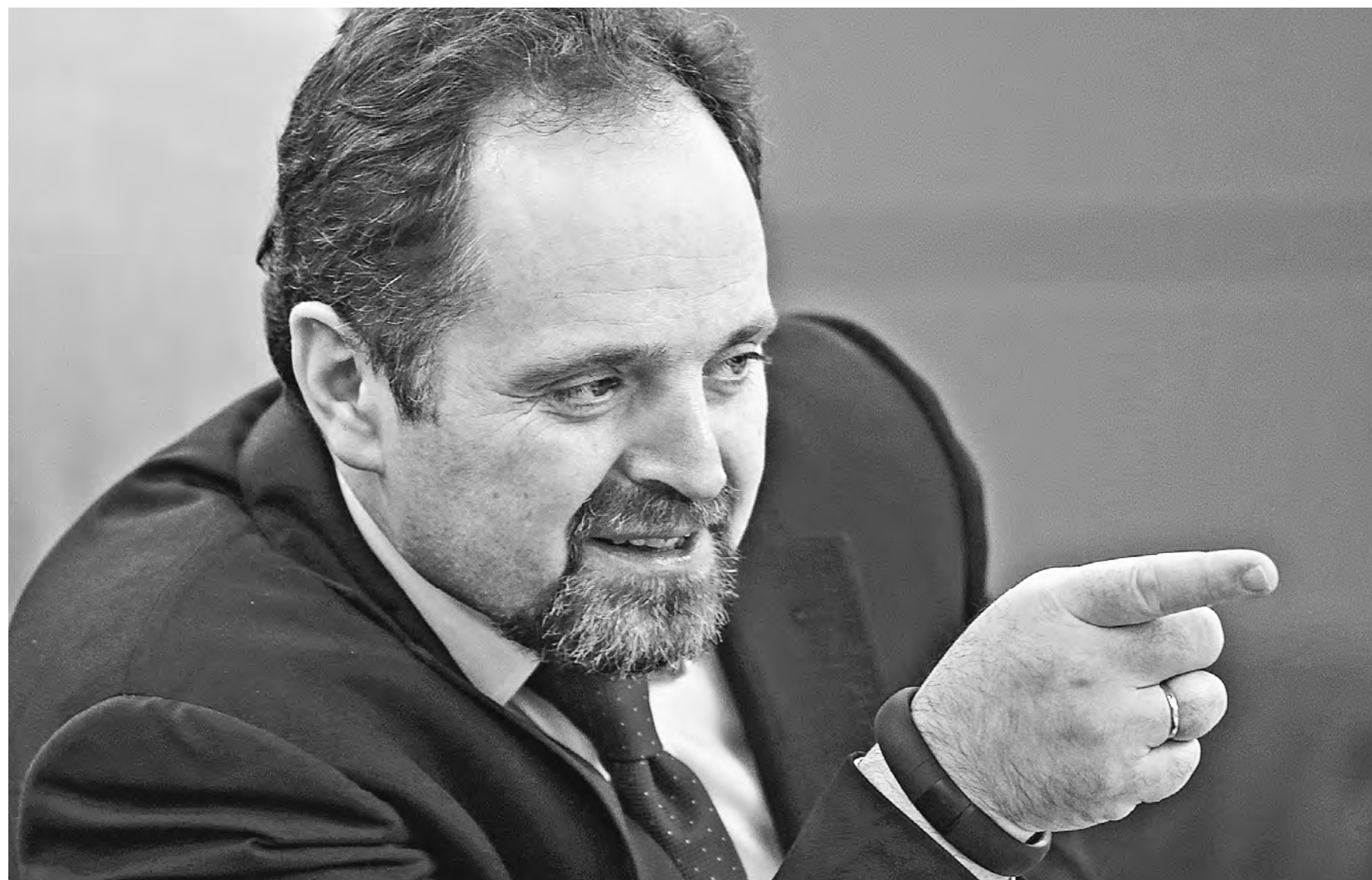
Министр природных ресурсов и экологии Сергей Донской пристально следит за организацией борьбы с пожарами в регионах.