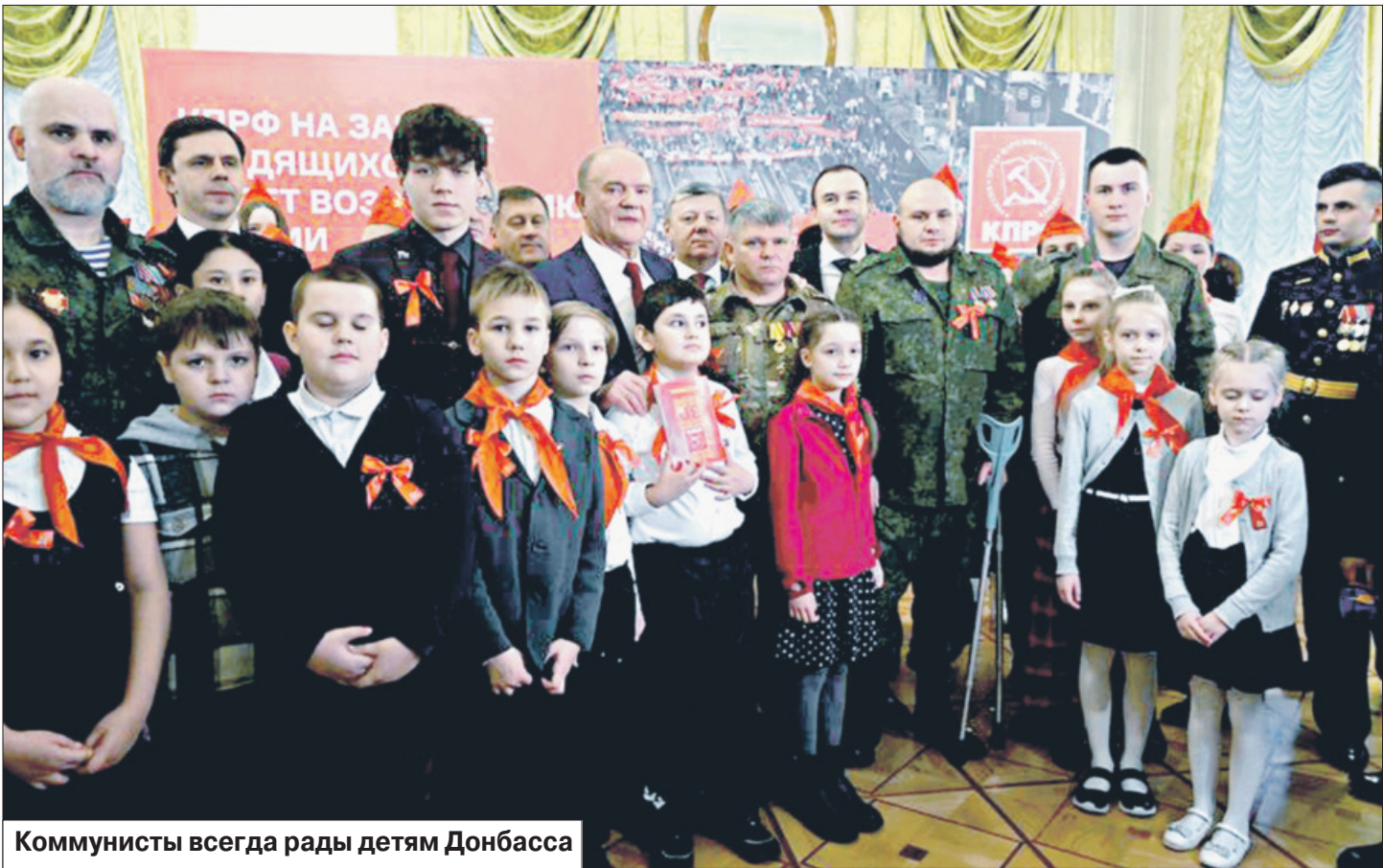
Коммунисты всегда рады детям Донбасса