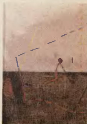
Обложка Ю. Сарафанова

Страх и неприятие Запада, противостояние Запад — вот устойчивая характеристика русской истории. Можно ли сломать этот стереотип? Об этом — в статье И. Яковенко.