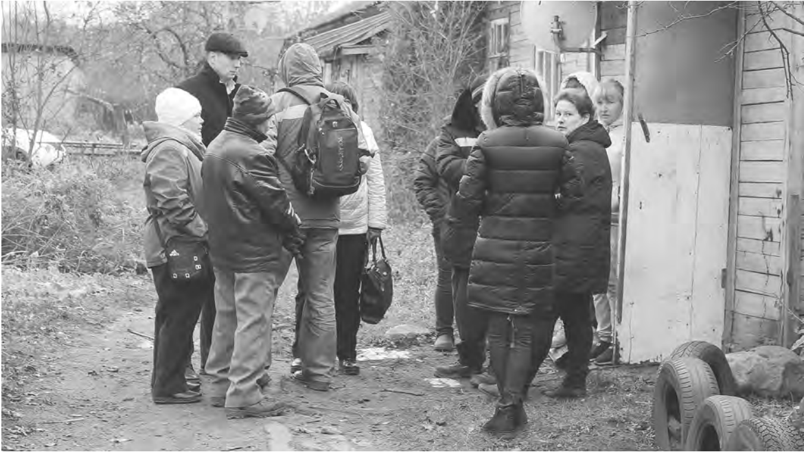
РЕГИОНАЛЬНОЕ ОТДЕЛЕНИЕ ОНФ В ТВЕРСКОЙ ОБЛАСТИ