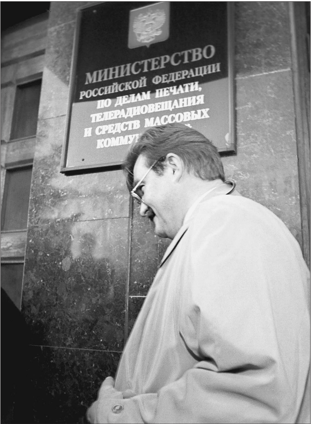
Евгений Киселев проходит мимо...

ЦИТАТА ДНЯ «Прочность карточного домика не зависит от количества козырей».