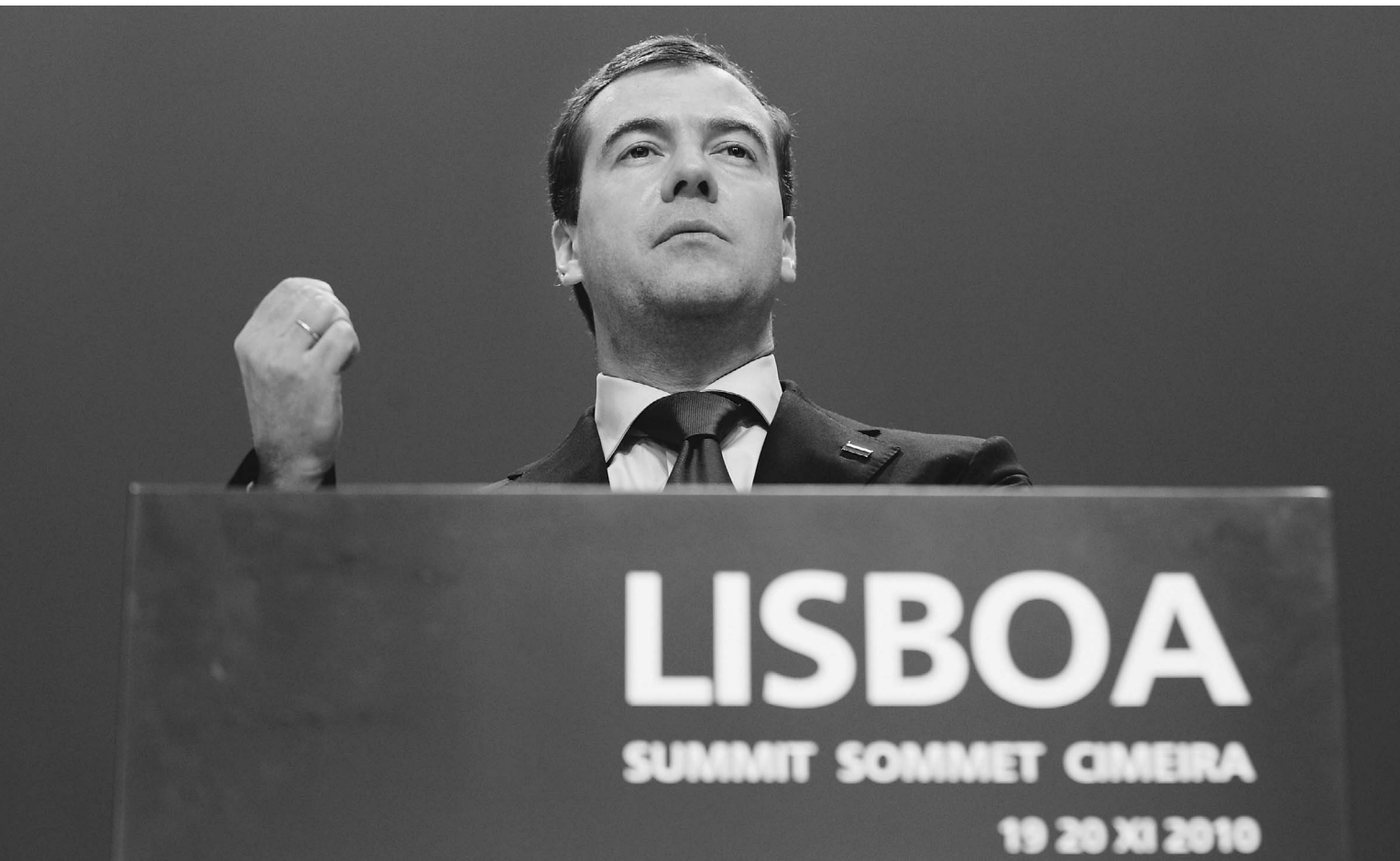
Дмитрий Медведев: между Россией и НАТО начинается очень важный этап продуктивных отношений

Россия и Североатлантический альянс становятся если не союзниками, то партнерами