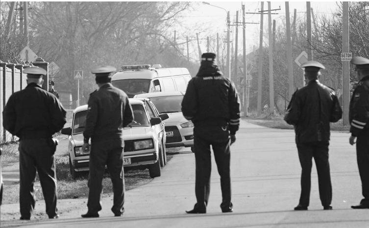
В Куцевской сейчас работают следователи. Не исключены новые задержания подозреваемых в жестоком преступлении 4 ноября