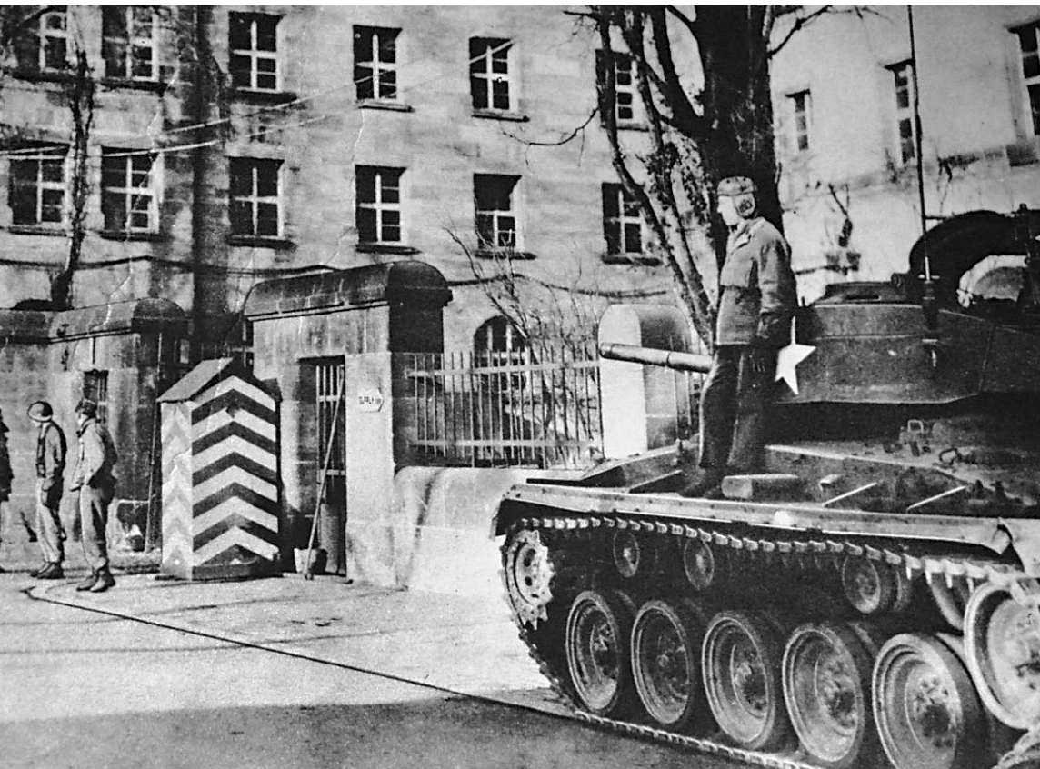
Когда в 1946 году пленные немцы из дивизии «Эдельвейс» организовали заговор с целью захватить здание Нюрнбергского суда, его охрану усилили. У входа выставили танки

ОФИЦИАЛЬНЫЕ (ЦЕНТРАЛЬНЫЙ БАНК РФ) КУРСЫ ВАЛЮТ К РУБЛЮ НА 20 НОЯБРЯ