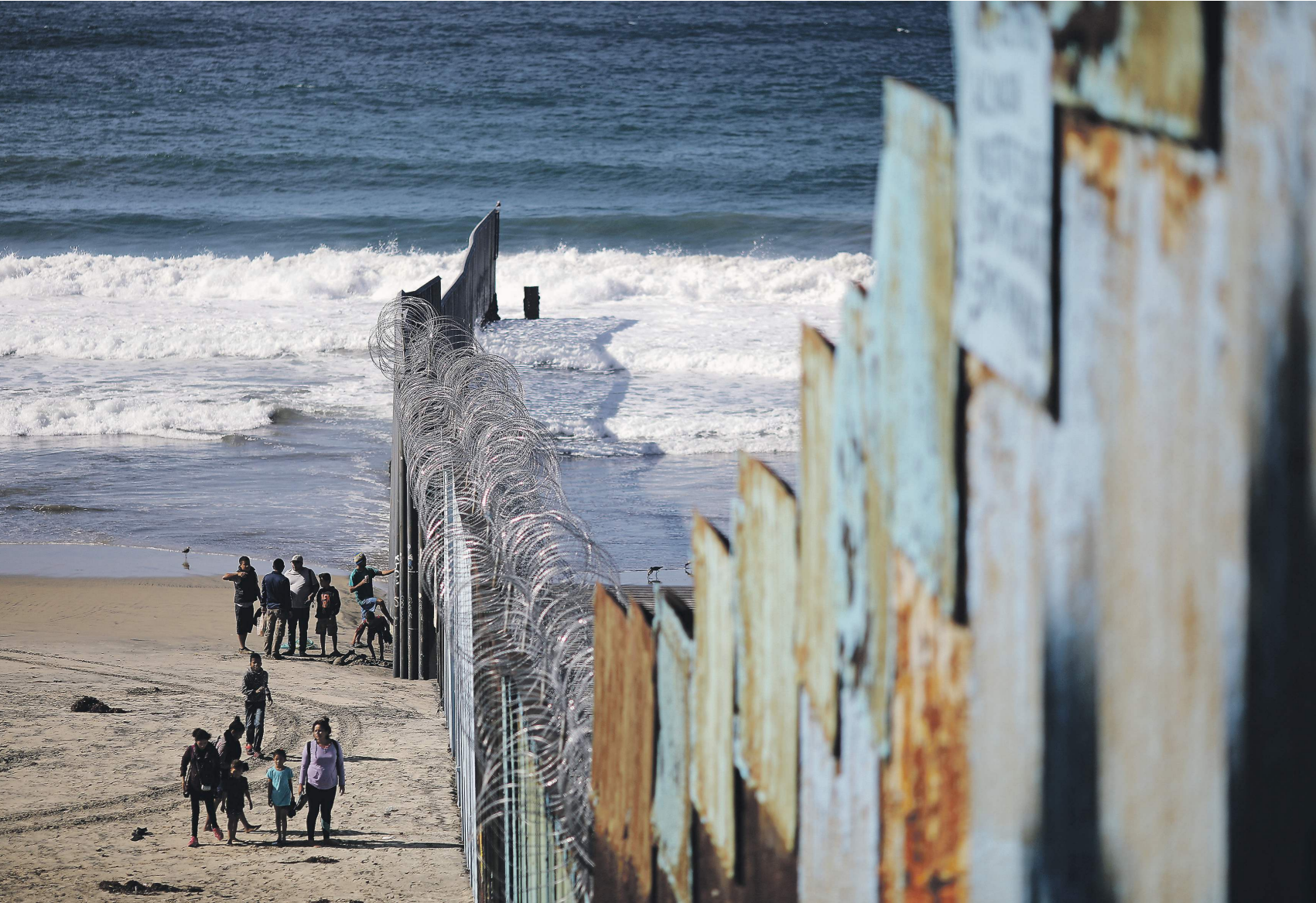
Дональд Трамп продолжает настаивать на выделении средств на строительство стены с Мексикой для защиты страны от нелегальных мигрантов