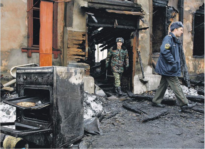
Установка плит с газ-контролем сократит количество инцидентов в жилых домах | ТАСС | Владимир Смирнов