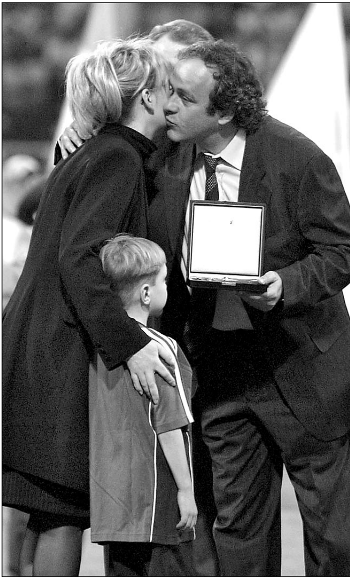
Киев. Вице-президент ФИФА Мишель ПЛАТИНИ вручает Рубиновый орден ФИФА дочери Валерия Лобановского - Светлане.