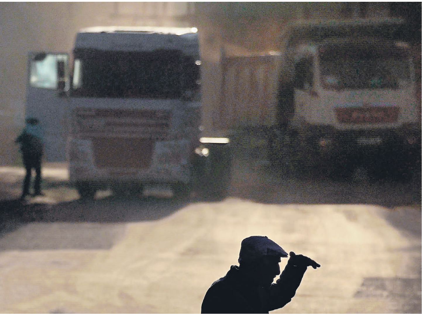
У российского автотранспорта в избытке грузов, но не хватает машин и водителей

Внутрироссийские перевозки подорожали на 15–20%, говорит коммерческий директор SOTA Logistic Кирилл Латинский.