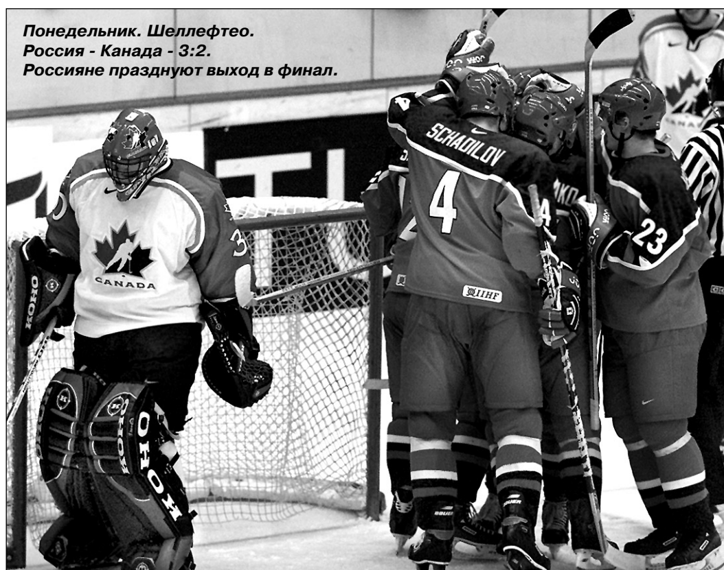
Понедельник. Шеллефтео. Россия - Канада - 3:2. Россияне празднуют выход в финал.