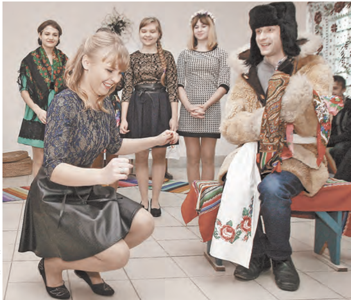
Чтобы «выкупить» у парня-Ящера свой платок, девушке главное не расстроиться.

Сценарий игры незамысловат и лишь немного варьируется в зависимости от местности.