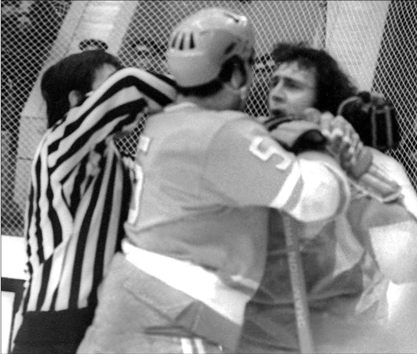
1972 год. Москва. Суперсерия-72. Защитник сборной СССР Александр РАГУЛИН против нападающего канадской команды Фила ЭСПОЗИТО (справа).

Полностью интервью Фила Эспозито корреспонденту «СЭ» - в ближайших номерах.