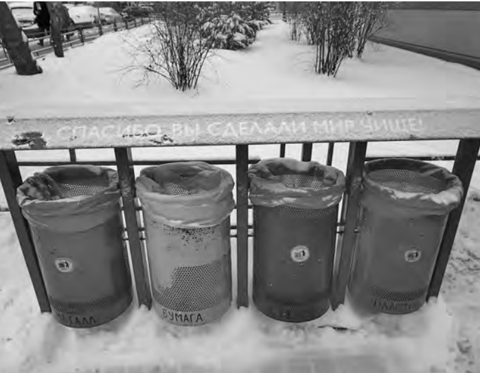
Пункты раздельного сбора мусора для россиян все еще в диковинку.