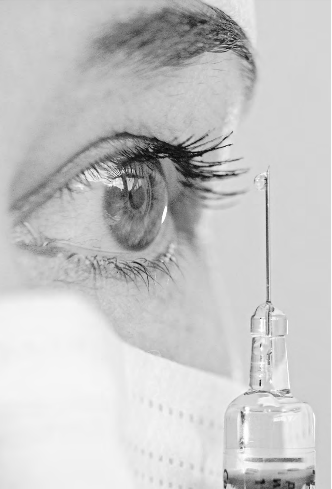
Берегитесь гриппа, чтобы не плакать потом.

ПРОБЛЕМА Доходы от теневого рынка мусора лишь немного проигрывают наркотрафику