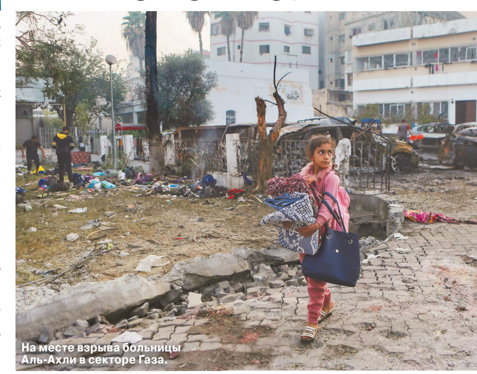
На месте взрыва больницы Аль-Ахли в секторе Газа.