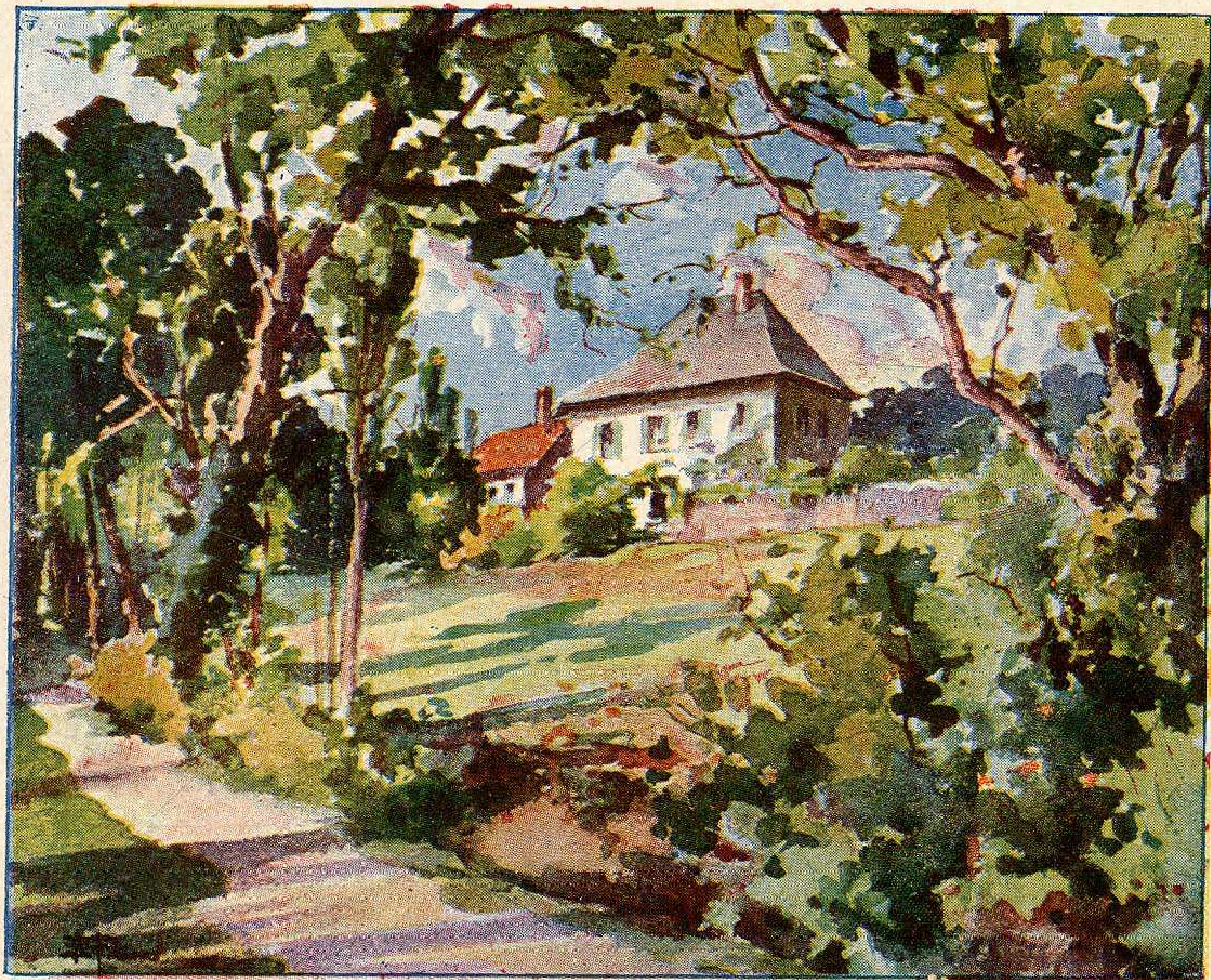
La Maison de J.-J. ROUSSEAU aux Charmettes (près Chambéry)