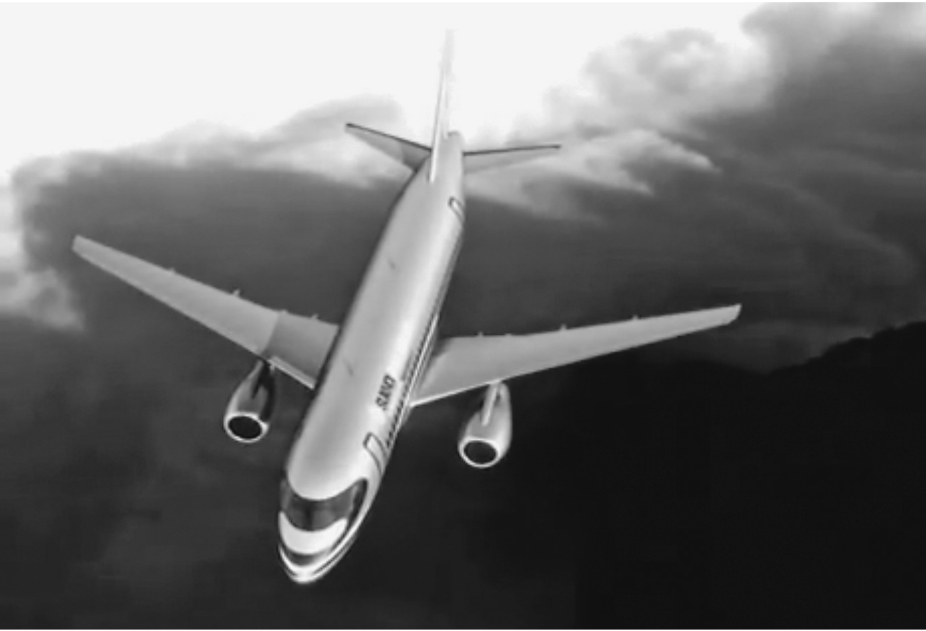
Бизнес-джету еще только предстоит оторваться от земли