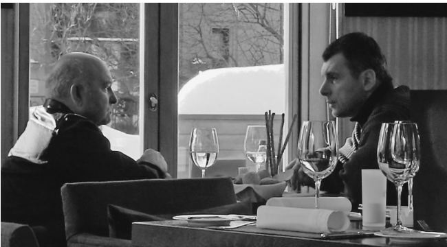
Юрий Лужков и Михаил Прохоров встретились в московском ресторане

Сам Михаил Прохоров рассказал, что давно дружит с Лужковым, поэтому время от времени проводит с ним встречи. Эту информацию «Известиям» подтвердил и бывший мэр Москвы. При этом Юрий Лужков уклонился от ответа на вопрос, готов ли он участвовать в выборах. «Сейчас это все так далеко, еще даже ничего не объявлено, а вы хотите, чтобы мы время тратили на такую чепуху», — заметил Лужков.