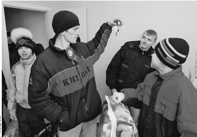
Ключи от квартиры получает только четверть сирот

В частности, тяжелое положение по жилью для сирот, по данным аудиторов, сложилось в Оренбургской, Смоленской и Волгоградской областях, в Кабардино-Балкарии и Карачаево-Черкесии. Например, в Кабардино-Балкарии в 2011 году жильем сиротам давали только на основании решения суда. «Никто из детей-сирот, состоящих на учете на получение жилья и не обратившихся в суд, не был обеспечен жильем помещением. Аналогичная ситуация сложилась и в Карачаево-Черкесской Республике», — пишет Степашин премьер-министру.